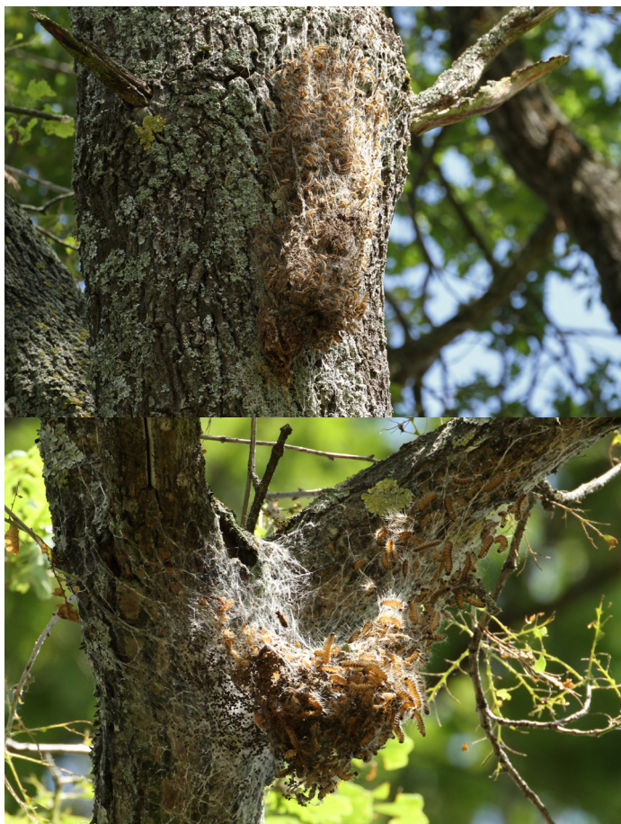
Abb. 2. Gespinnstnester des Eichenprozessionsspinners.

In der Schweiz waren bisher hauptsächlich gut besonnte Eichen im Siedlungsgebiet oder entlang von Waldrändern von Befällen des EPS betroffen. Oft handelte es sich um lokale Befälle von einzelnen oder wenigen Wirtsbäumen. Anfang Juni 2026 wurde im Kanton Schaffhausen erstmals einen mehrere Hektaren umfassenden, flächigen Befall in einem eichen-dominierten Laubwald festgestellt. Betroffen waren hauptsächlich Traubeneichen in den Altersklassen Stangenholz bis Altholz. An den befallenen Eichen konnten mit Hilfe des Feldstechers oft mehrere Gespinnstnester in Handtellergrösse beobachtet werden. Allerdings wurden bis zum Publikationszeitpunkt noch keine auffälligen Frassschäden festgestellt. Steigt die Populationsgrösse aber im nächsten Jahr weiter an, so könnte es in Folge zu deutlichen Frassschäden an den Eichen kommen.