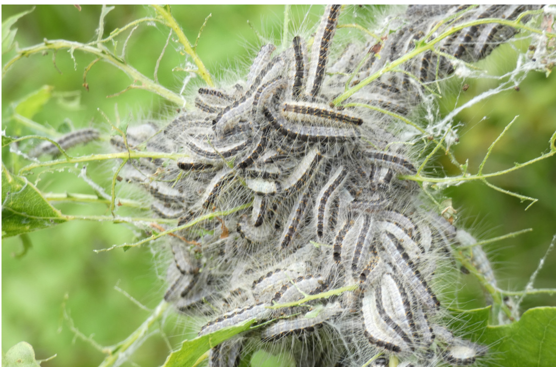
Abb. 1. Raupen des Eichenprozessionsspinners.

Die behaarten Raupen mit dunklem Längsband (Abb. 1) schlüpfen ab Mitte April und fressen anschliessend an den Blättern verschiedener Eichenarten. Insgesamt durchlaufen die gesellig lebenden